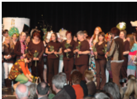
Die beteiligten Lehrerinnen