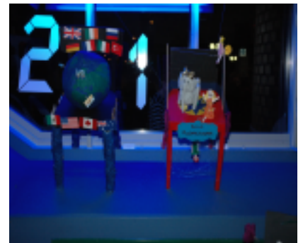
Kunstobjekte aus alten Stühlen