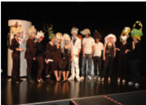
Frisuren im recyceltem Look