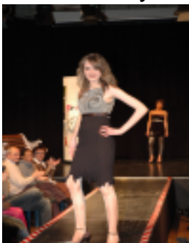
Von modisch chic...